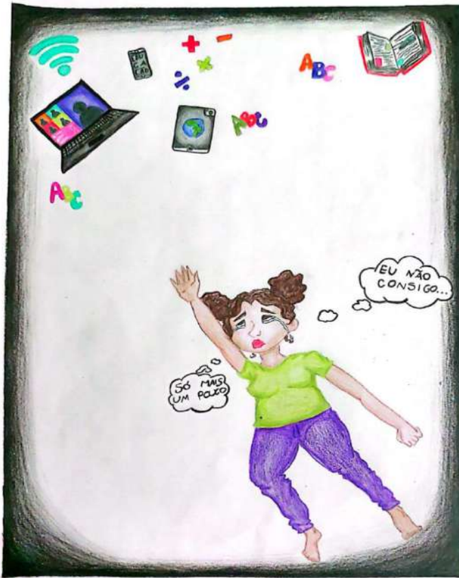
Figura 1 - Autorretrato