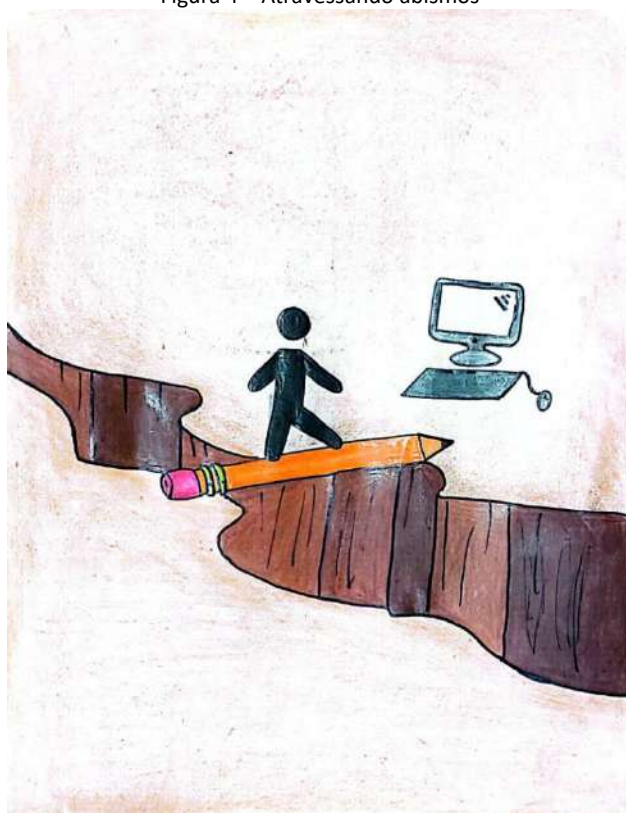
Figura 4 – Atravessando abismos