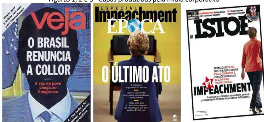
Figuras 1, 2 e 3 - Capas produzidas pela mídia corporativa

As imagens 1, 2, e 3, retiradas da mídia corporativa, ao articularem os textos verbal e não verbal, publicaram o fim dos governos Collor e Dilma. Collor, sem rosto (imagem 1); Dilma, de costas (imagem 2), como se estivesse de saída, em consonância com os usos linguísticos “fim”; “último ato”; “ impeachment ” (imagem 3), em que sobre a letra P lemos PT constroem um efeito de derrocada dos presidentes.