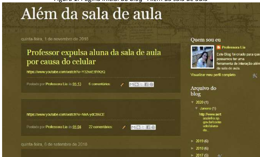
Figura 1. Página inicial do blog “Além da sala de aula”