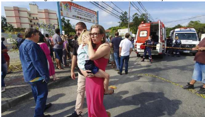
Figura 6. Imagem veiculada na matéria da revista Veja.

escola, imagens que fazem circular discursos de medo, de horror. Aqui, a tragédia está circunscrita no ambiente escolar, a foto tenta controlar outras possibilidades de interpretação, o leitor não é provocado a relacionar a violência noticiada a outros fenômenos sociais de violência.