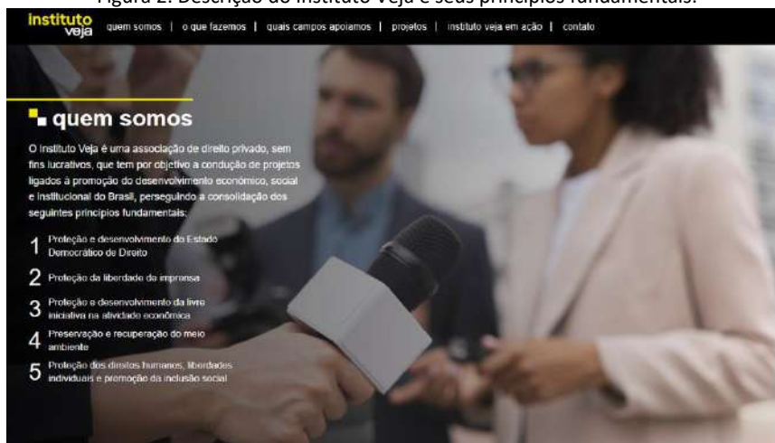
Figura 2. Descrição do Instituto Veja e seus princípios fundamentais.

A revista Veja, também analisada no presente capítulo, pertence ao grupo editorial Abril, abarcando diversas revistas como Quatro Rodas, Claudia, VocêRH, Placar, Capricho, Guia do Estudante, Você S/A, entre outras. No site da revista Veja, há informações sobre o Instituto Veja, com a descrição de seus princípios, como pode ser visualizado na Figura 2, a seguir: