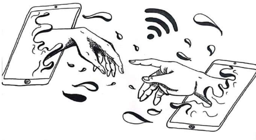
Figura 2 – Intertexto da Obra “A criação de Adão” de Michelangelo

Analise, a seguir, a imagem produzida pelo sujeito-aluno C. M., que estuda na primeira série do Ensino Médio: