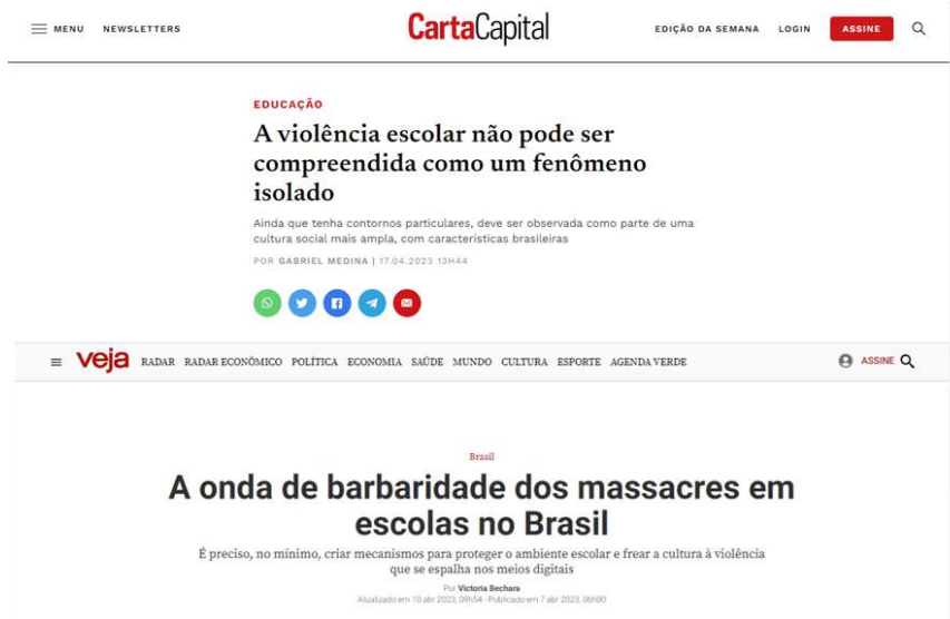
Figura 4. Matérias das revistas Carta Capital e Veja que compõem o corpus deste estudo

no site da revista Veja, na semana anterior, no dia 10 de abril de 2023. A Figura 4 compila os cabeçalhos dessas matérias: