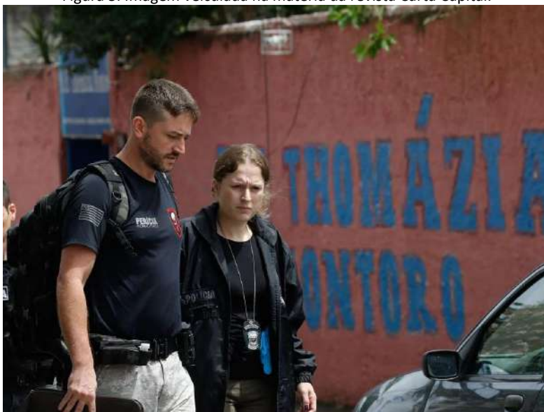
Figura 5. Imagem veiculada na matéria da revista Carta Capital.

Analisamos, também, os textos visuais que constroem as notícias. A Carta Capital utiliza a imagem dos Peritos da Polícia em frente à Escola Estadual Thomazia Montoro, conforme pode ser observado a seguir: