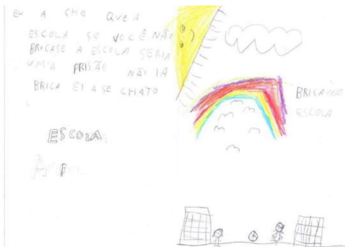
Transcrição do Texto: Sujeito X

“Eu a cho que a escola se você não bricase a escola seria uma prisão não ia brica ei a se chato.”