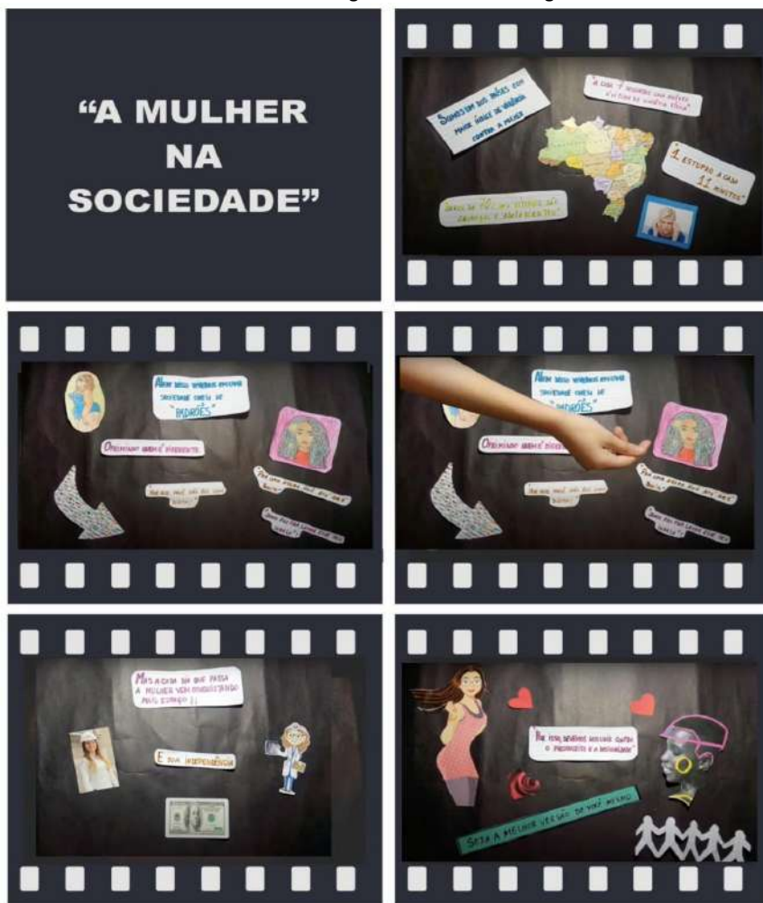
Figura 1 – Recorte de telas de vídeo-minuto elaborado a partir de imagens disponíveis no banco de imagens do buscador Google.