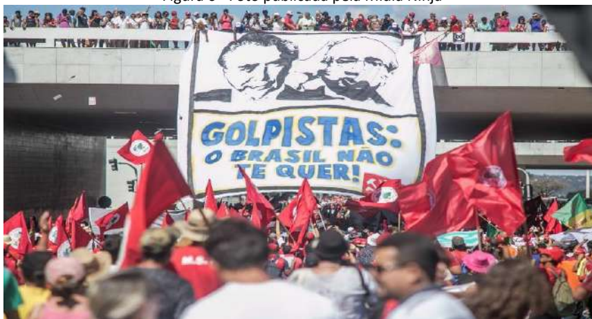
Figura 6

Observaremos, portanto, as proliferantes enunciações que o dispositivo midiático fez circular para constituir os sentidos sobre impeachment e sobre golpe, a começar pelas manifestações que ocorreram no dia da votação do impeachment de Dilma Rousseff, na Câmara dos Deputados, em 17 de abril de 2016, como mostra a imagem a seguir, veiculada na Mídia Ninja: