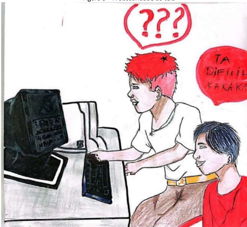
Figura 3 – A obscuridade da tela