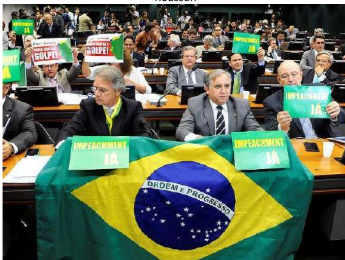
Figura 7 - Foto de parlamentares no contexto do impeachment da presidenta Dilma Rouseff

Na imagem a seguir, a predominância das cores verde e amarelo sinalizam o desejo do impeachment , criando o efeito de sentido de que a maioria dos parlamentares estavam do lado do Brasil e dos brasileiros e contra a corrupção que, no caso, é representada pela cor vermelha, do Partido dos Trabalhadores (PT), que era o partido da presidenta Dilma. A foto mostra apenas dois parlamentares com cartazes que trazem a cor vermelha e o enunciado “golpe”; os parlamentares que têm as placas com o enunciado “ Impeachment já ” apoiam-nas sobre a bandeira brasileira, reforçando o sentido de patriotismo.