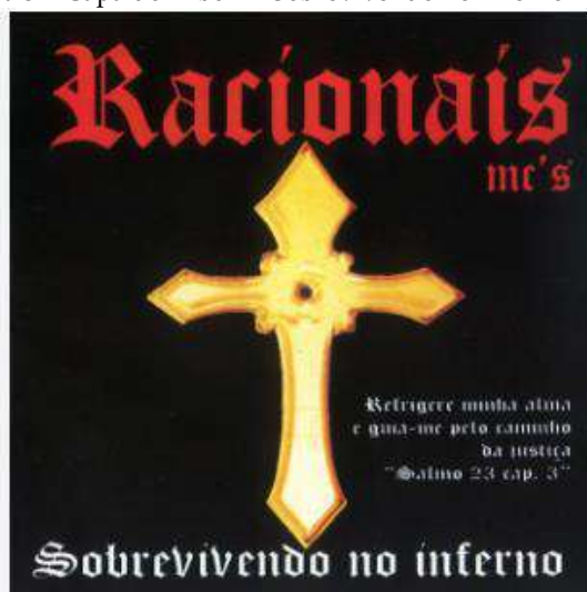
Figura 5 – Capa do Álbum “Sobrevivendo no Inferno” (1997)

Captura de tela do videoclipe “Diário de um Detento”, do grupo Racionais MC’s.