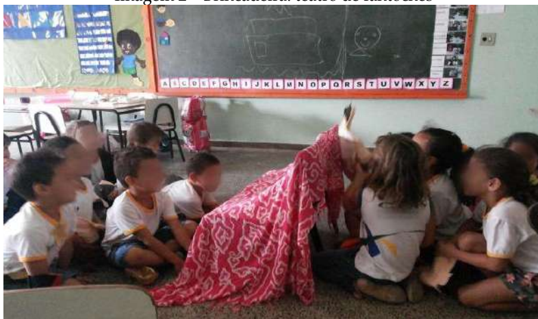
Imagem 2 – Brincadeira: teatro de fantoches

enredo é o teatro de bonecos ou de fantoches, trata-se de uma brincadeira pautada em uma manifestação artística.