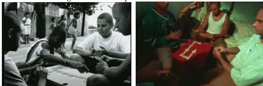
Captura de tela do videoclipe “Diário de um Detento”, do grupo Racionais MC’s.

O clipe se inicia com a sequência dessas duas imagens, na ordem aqui apresentadas, o que possibilita fazer uma associação direta de que essas crianças que jogam dominó na praça são os adultos que agora, presos, jogam na cadeia. O uso das cores utilizadas em cada imagem revela uma intencionalidade de causar no espectador a sensação de tempo passado e presente, respectivamente. O clipe já anuncia, logo ao início, a partir de elementos visuais e cinematográficos, que existem realidades vivenciadas no Brasil que, de certa forma, tendenciam à uma determinada trajetória a qual o sujeito estará totalmente vinculado. O pensamento de Vigotski nos auxilia a pensar como esse modo de organizar e estruturar a realidade faz, de fato, parte de nossa construção social, mas que a superação desse formato nos indica uma capacidade mais ampla e complexa de olhar e viver os fenômenos sociais, principalmente por meio daquilo que ele elencou como vivência. Para o autor “vivência é uma unidade na qual se representa, de modo indivisível, por um lado, o meio, o que se vivencia – a vivência está sempre relacionada a algo que está fora da pessoa, e por outro lado, como eu vivencio isso” (2018, p. 78).