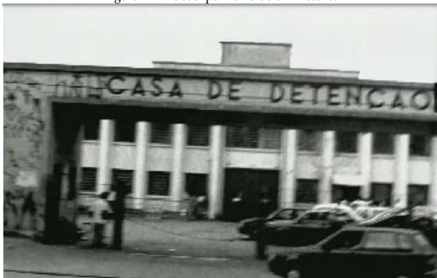
Figura 1 – Videoclipe Diário de um Detento

Captura de tela do videoclipe “Diário de um Detento”, do grupo Racionais MC's.