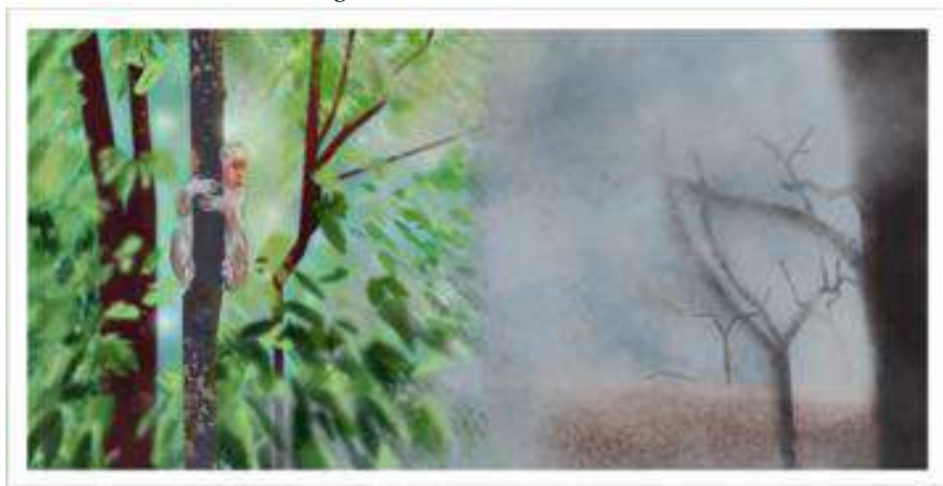
Figura 2 – Macaco Assustado

“Não é nada fácil captar e reproduzir a sonoridade desse líquido” (Krause, 2013, p. 22) Como você o faria? Eu tentei, no primeiro áudio, simular a ideia do que seria o mar. Mas como o autor falou, não é fácil. Existem diferentes nuances, e representar todas tornou-se um desafio. Testar diferentes materiais e buscar o som do borbulhado, o que o vento faria em um dia de tempestade, as gotas de água que caem.