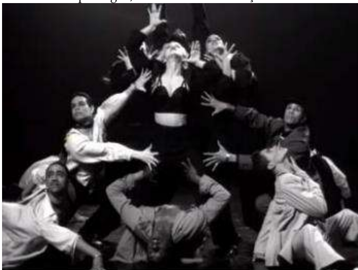
Figura 1 - videoclipe Vogue, com Madonna e dançarinos da cena Ballroom