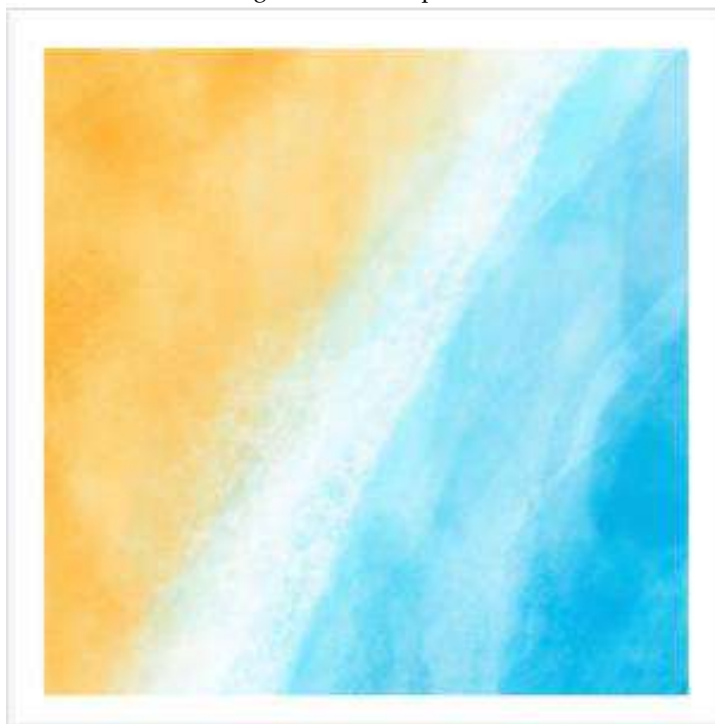
Figura 1 – d == Aquarela

Uma proposta de sequência didática em sala de aula é a de ouvir atentamente o som proposto para então dialogar, refletir sobre as características desses sons, e buscar referências imagéticas para tal, através de um desenho ou imagem, e por fim, engajar uma listagem desses sons apresentados com o objetivo de reproduzi-los coletivamente em sala.