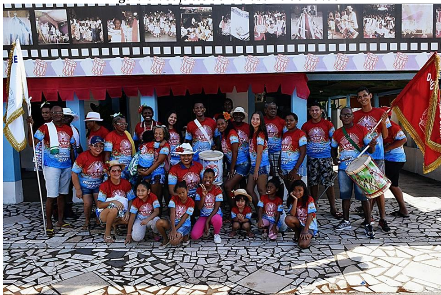
Figura 07: Sujeitos do Marabaixo do Pavão