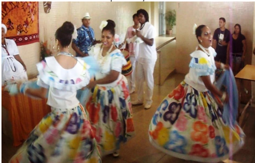
Frame 03: Grupo de dança de Marabaixo