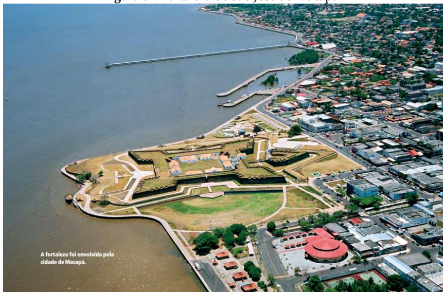
Figura 02: Fortaleza de São José de Macapá 12