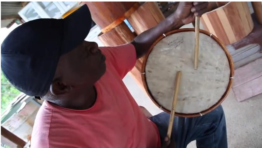
Frame 04: Artesão testando uma caixa de marabaixo

Foucault (2013b, p. 8, grifo do autor), lançando o seu próprio corpo como exemplo, afirma que a utopia “[...] é um lugar fora de todos os lugares, mas um lugar onde eu teria um corpo sem corpo , um corpo que seria belo, límpido, transparente, luminoso, veloz, colossal na sua potência, infinito na sua duração, solto, invisível, protegido, sempre transfigurado”. O desejo de sair do corpo tópico dá lugar aos corpos utópicos. No caso dos sujeitos negros do Marabaixo, eles não somente se transfiguram com suas vestimentas e adereços em corpos utópicos, mas também se constituem sujeitos, dão vida ao Marabaixo, mesmo vivendo experiências de acontecimentos revestidos de poderes (o exercício de deslocamento do centro de Macapá; fechamento das portas da igreja; dizeres que deslegitimaram esses sujeitos etc.).