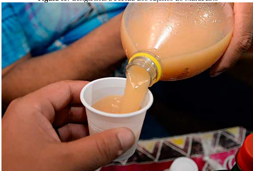
Figura 05: Gengibirra: a bebida dos sujeitos do Marabaixo

acrescenta que se o ambiente estiver vazio, o sujeito “[...] sentirá a tendência a preencher este vazio por uma revalorização dos elementos ditos ‘materiais’ do seu ambiente”. Então, a ideia que formulamos a partir disso é que, em um gesto de exercício de poder, os sujeitos negros revalorizaram esses elementos ao mesmo tempo em que rostificavam o Marabaixo e se constituíam como sujeitos dessas práticas. Assim, o som, os ladrões e as danças foram mecanismos de resistência contra as ações repressoras da Igreja e, também, do Estado.