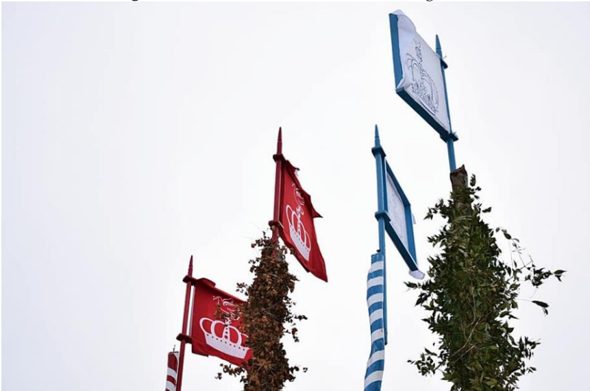
Figura 08: Os mastros no Marabaixo do Laguinho