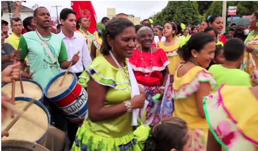
Frame 02: Marabaixo nas ruas de Macapá

Na atualidade, o Marabaixo não é cultuado pela maioria da população amapaense, tampouco pela maioria dos sujeitos negros de Macapá. O Ciclo é cultuado por grupos minoritários de famílias de negros tradicionais. No Frame 02, temos as imagens dos sujeitos negros com seus adereços, com as caixas, dançando e cantando os versos dos ladrões de marabaixo pelas ruas da capital do Amapá.