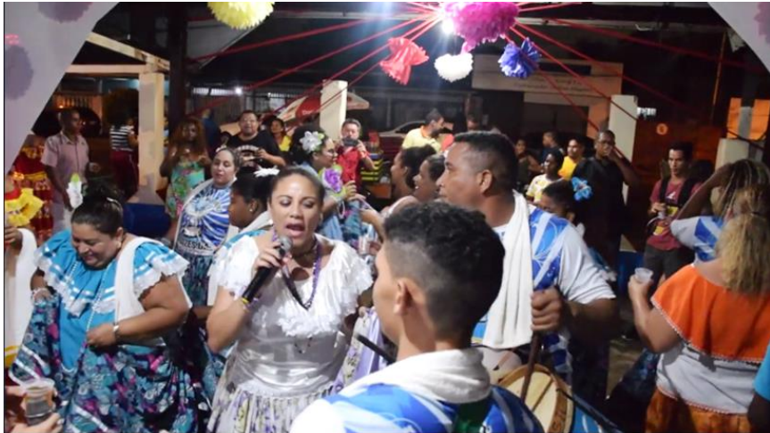
Frame 10 01: Barracão de Mestre Pavão

Oliveira (1999), descrevendo o ritual da dança, aponta que as mulheres se movimentam em círculo ao redor do salão, com alguns homens tocando os tambores ao centro (Cf. Frame 01). Normalmente, “[...] uma das mulheres ou um tocador ‘joga’ os versos que são respondidos pelas dançadeiras que ao mesmo tempo dançam e fazem o coro ou cantam juntas todo o ‘ladrão’” (OLIVEIRA, 1999, [8] p.).