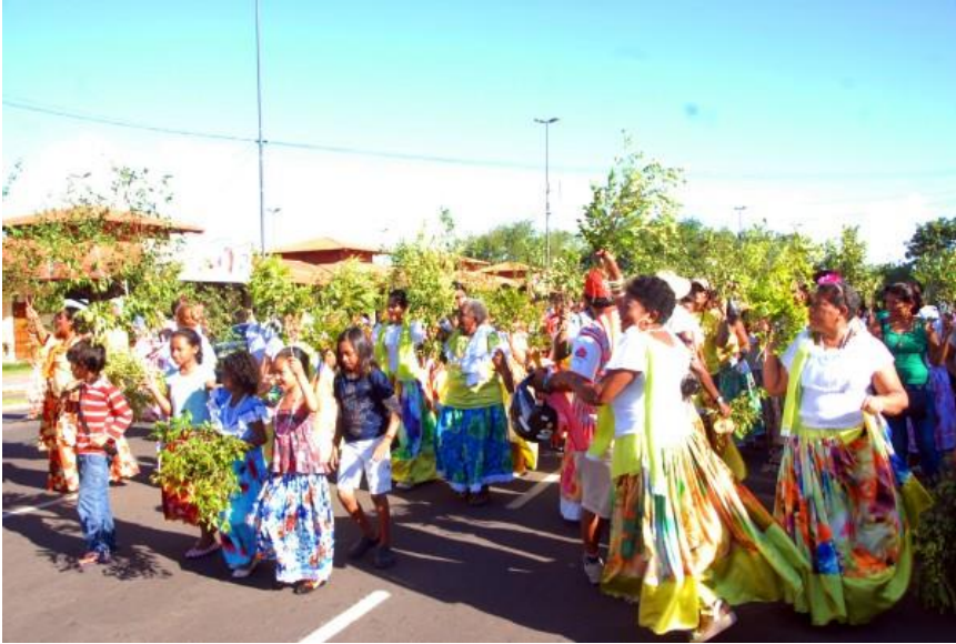
Figura 06: Marabaixo das Murtas pelas ruas de Macapá