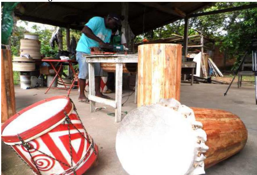
Figura 01: Artesão confeccionando caixas de marabaixo

As caixas de marabaixo são instrumentos de percussão construídos pelos próprios sujeitos negros, com troncos de árvores e couro de animais (Figura 01). São instrumentos rústicos herdados dos primeiros negros vindos da África e funcionam como uma espécie de ligação entre o passado e o presente. O som produzido por essas caixas, que dá singularidade ao Marabaixo, foi objeto de conflito entre Igreja Católica e sujeitos negros, pois remetia às práticas de negros.