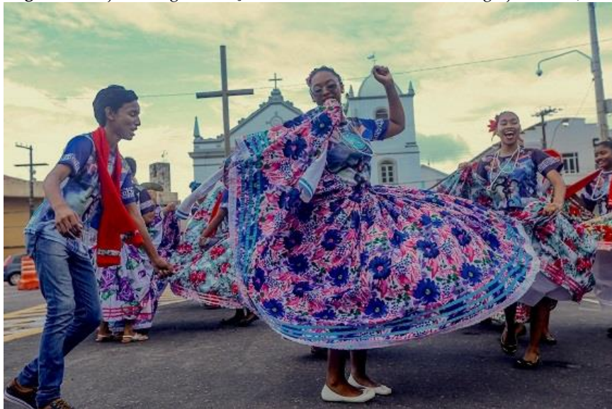
Figura 03: Sujeitos negros dançando o Marabaixo na frente da igreja de São José

primeira metade do século XX. O primeiro 14 processo de silenciamento foi ocasionado pela Igreja Católica, o qual, apoiado em Foucault (2011), o inscrevemos como um acontecimento de amplitude maior, pois tomou como base as práticas religioso-discursivas dos sujeitos do Ciclo do Marabaixo macapaense. Em meados da década de 1940, a Igreja intensificou os conflitos com os sujeitos negros do Marabaixo por considerar as suas práticas profanas e imorais e, assim, proibiu o Marabaixo dentro das instalações da igreja matriz de São José de Macapá. Era tradição, no Ciclo, fazer os cortejos até a igreja matriz e, com a proibição da Igreja, os sujeitos negros do Marabaixo não puderam mais entrar no estabelecimento religioso; entretanto, mantiveram o ritual até a frente da igreja (Cf. Figura 03).