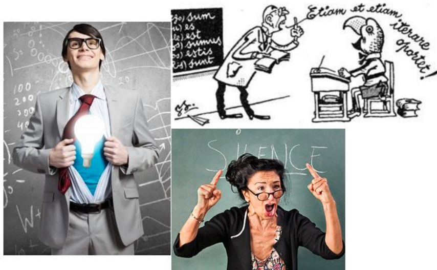
Imagem 5: Professor jesuíta, professor colonizador e professora ditadora. 14

Em outro texto, Mattos (2015) descreve uma atividade de sala de aula em que a professora solicita a seus alunos que escrevam uma carta formal de reclamação pedindo providências em relação a produtos que foram adquiridos pela internet e apresentaram defeitos. A autora argumenta que