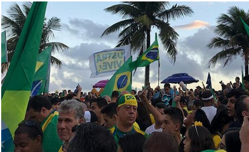
Imagem 4: Comemoração da vitória de Jair Bolsonaro nas eleições presidenciais de 2018. 12

Nesse contexto, evidencia-se a importância de um trabalho sobre memória e pós-memória, interligadas pela experiência, pela convivência e pelas narrativas, que são uma forma de pensar e de organizar as experiências humanas, como uma maneira de conhecer o mundo, o outro e a nós mesmos (BRUNER, 2002). Desse modo, as narrativas são responsáveis por estabelecer as regras que permitem o convívio e as relações sociais, o que significa que nós, como indivíduos, estamos ligados uns aos outros e também aos contextos a que pertencemos e em que atuamos. Na próxima seção, abordaremos esses conceitos que formam a base teórica deste trabalho.