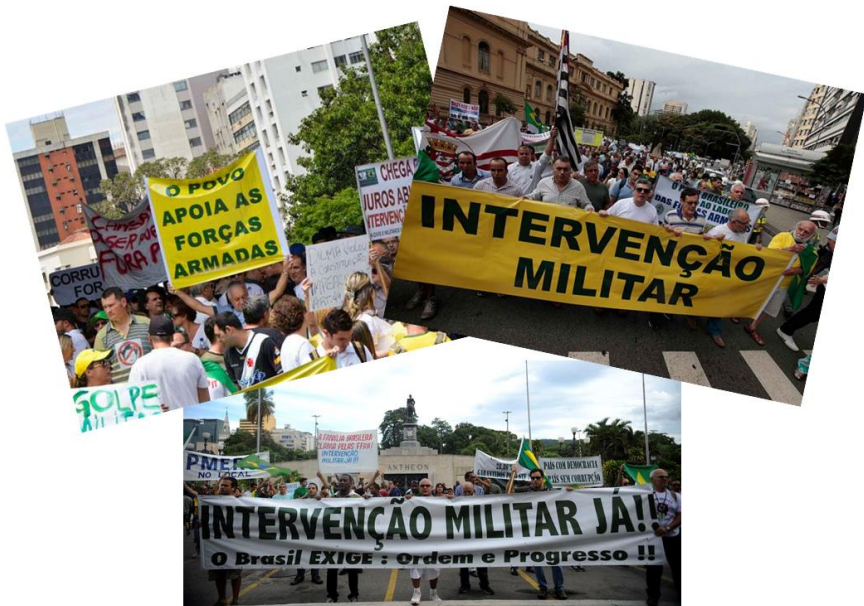
Imagem 3: Manifestações em favor de intervenção militar durante o processo de impeachment da ex-Presidenta Dilma Rousseff (2015-2016). 11