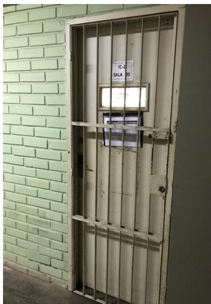
Imagem 2: Porta de sala de aula 10

Vemos na Imagem 2 um exemplo dessa arquitetura prisional de nossas escolas: