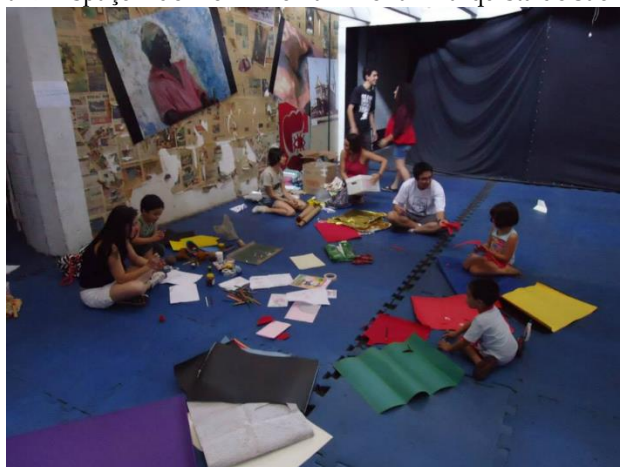
Figura 2 - Espaço Adelino Pinho na 4ª Feira Anarquista de São Paulo.