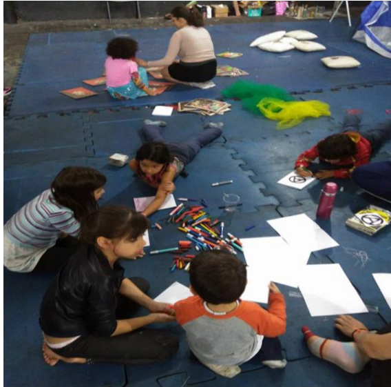
Figura 3 - Oficina de encadernação com crianças na Feira Anarquista de São Paulo, na 7ª edição/2016.