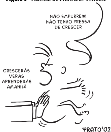
Figura 1 - A autoria de Francesco Tonucci.

Disponível em: https://www.fe.unicamp.br/eventos/infancia/