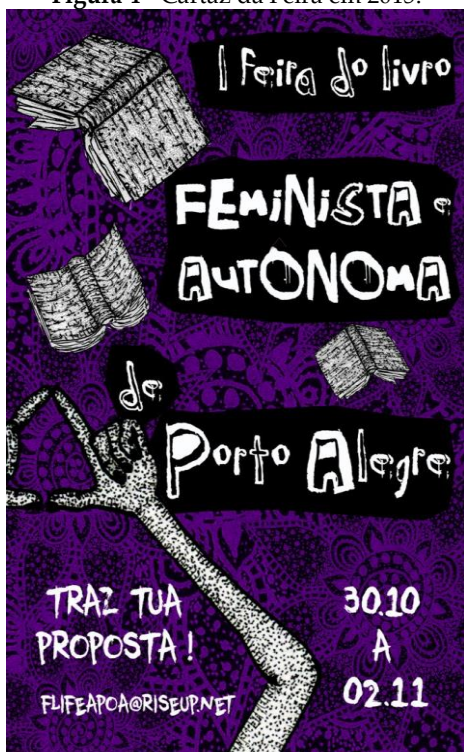
Figura 4 - Cartaz da Feira em 2015.